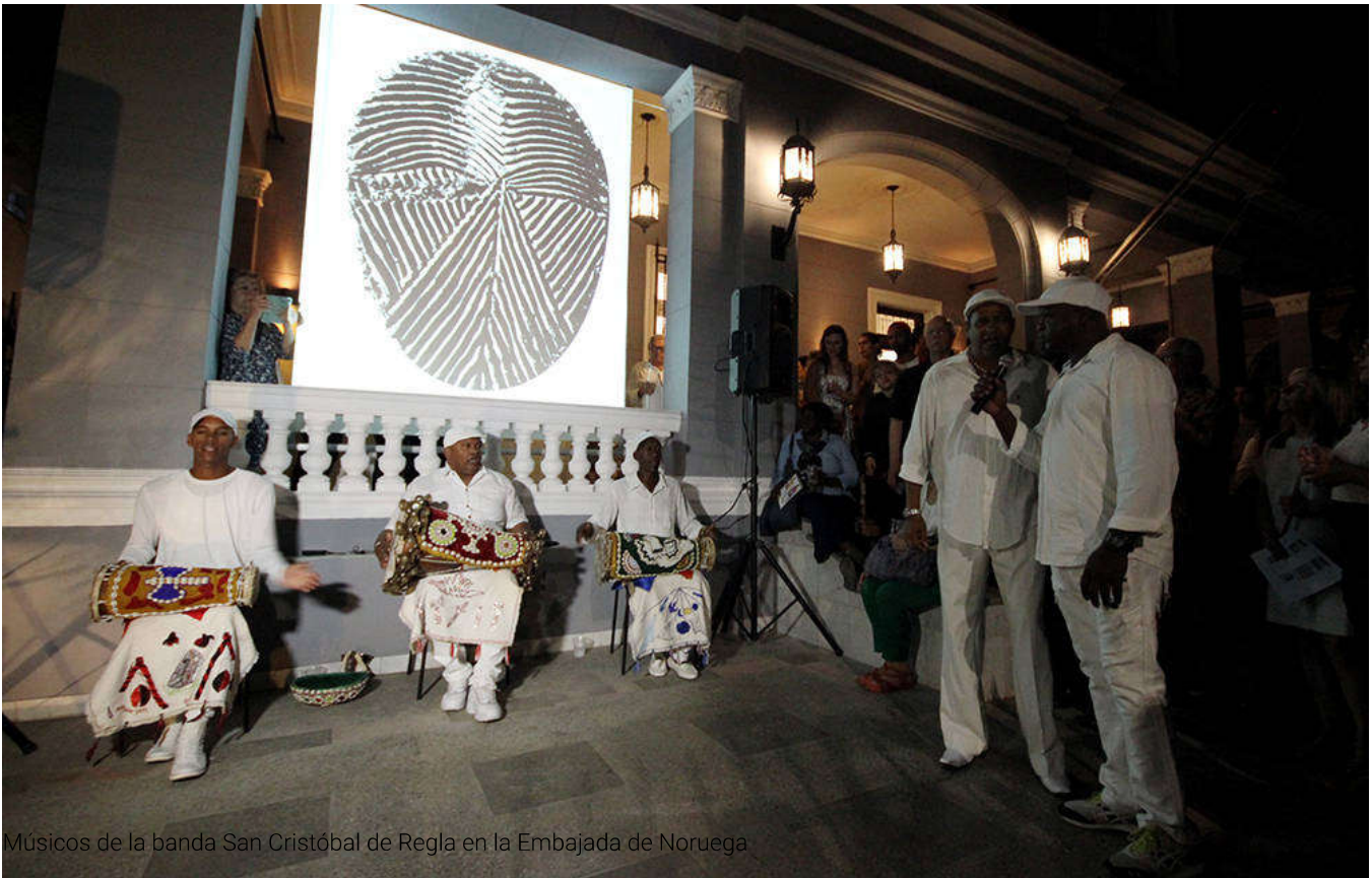
Músicos de la banda San Cristóbal de Regla en la Embajada de Noruega