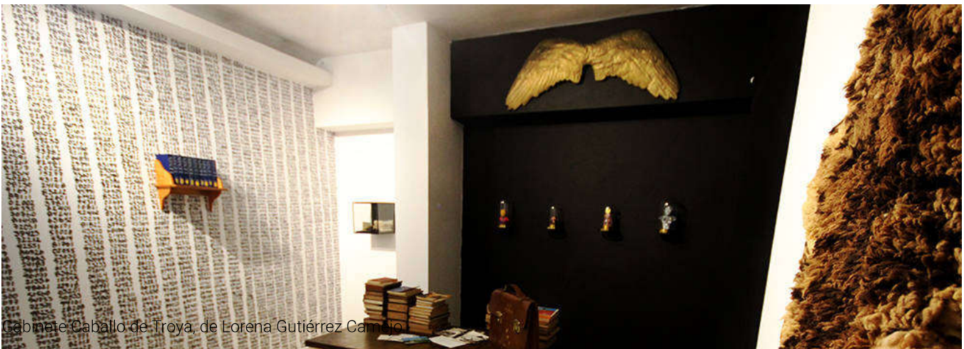
Gabinete Caballo de Troya, de Lorena Gutiérrez Camacho

Así nació El rostro de la nación , que tendrá tres actos durante la Bienal, el primero fue este, luego le seguirá el de Factoría Habana y por último una instalación en Estudio 50.