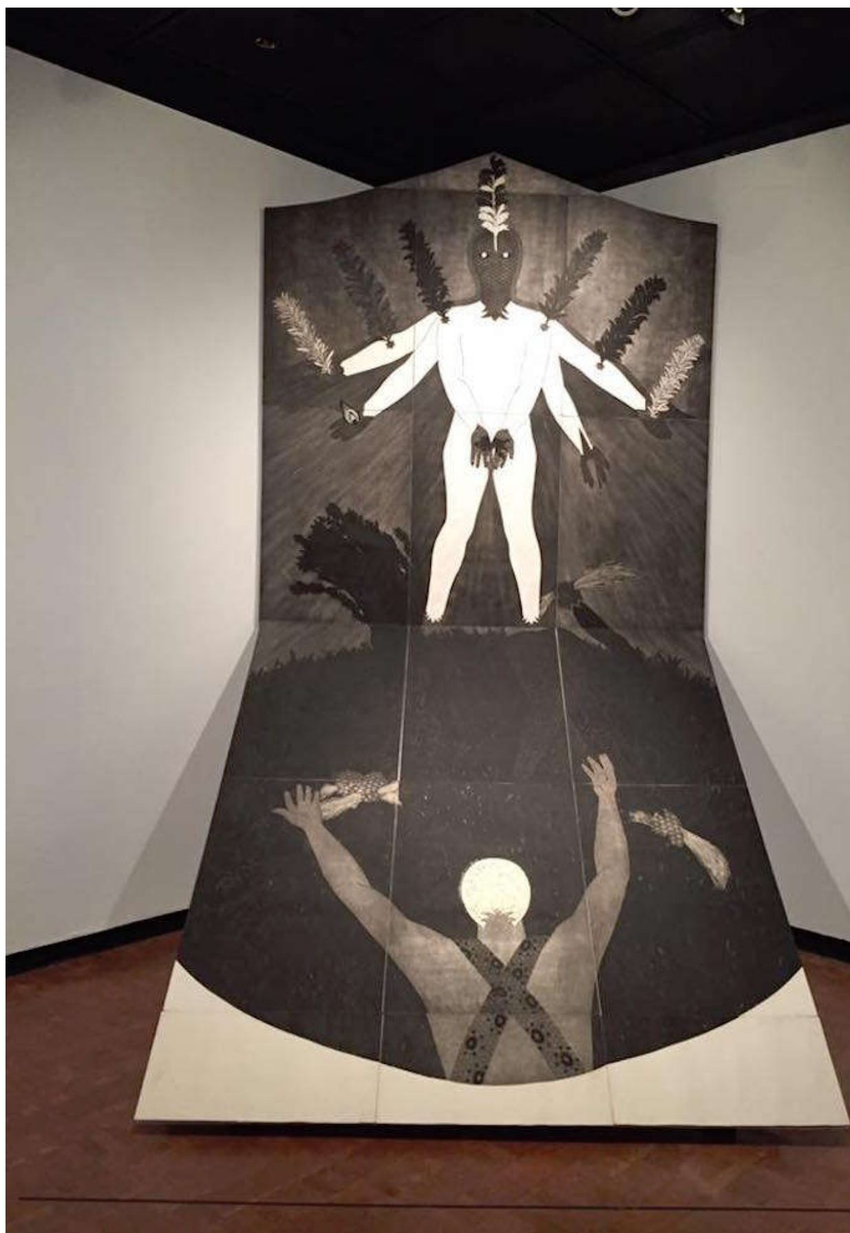
Una obra en tres dimensiones por Belkis Ayón, presentada en la zona