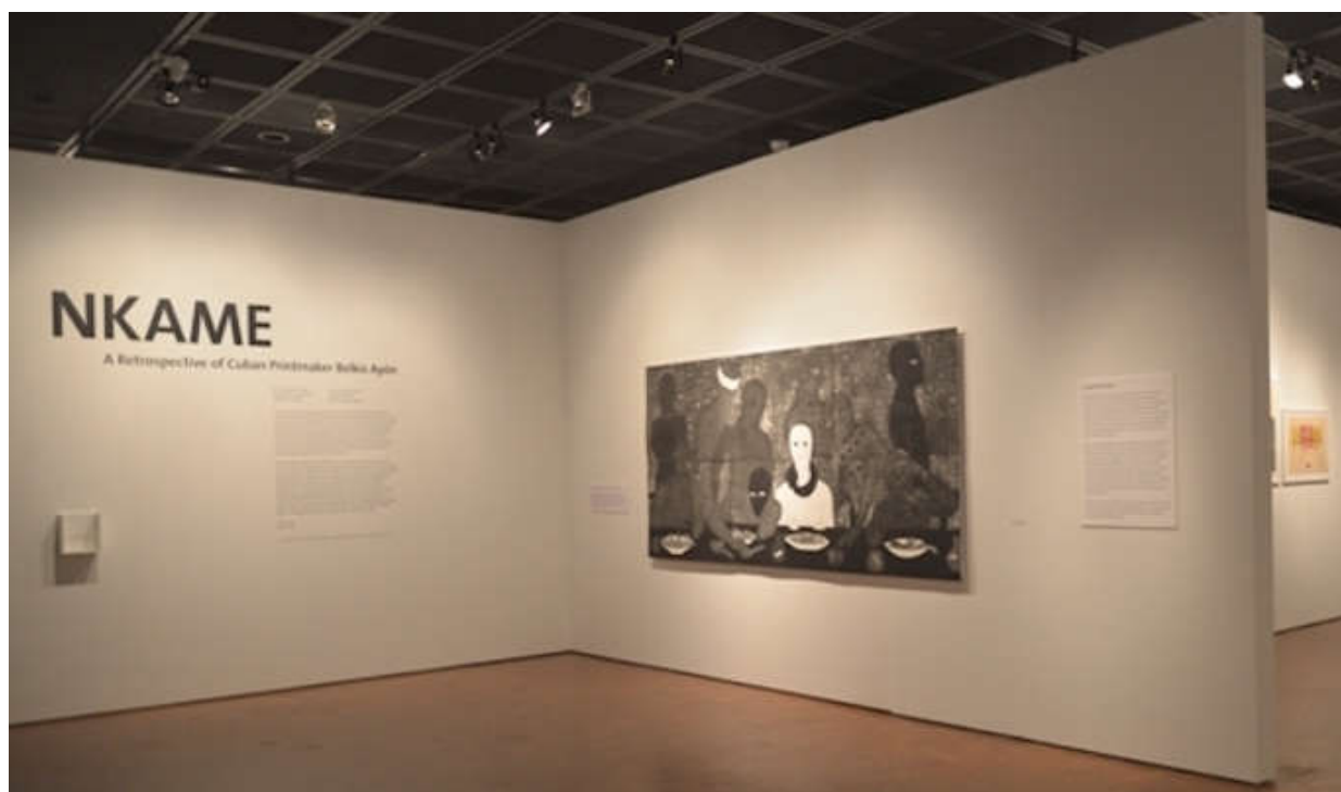
Una vista de la expo Nkame: A Retrospective of Cuban Printmaker Belkis Ayón.

La exposición Nkame actualmente en el Fowler Museum en UCLA es una versión algo igualmente antológica, de la que curé en septiembre de 2009 junto al Estate de Belki Convento San Francisco de Asís de La Habana. En aquella ocasión seleccioné 83 obra con énfasis en sus trabajos desde 1991. Para esta versión de Nkame en el Fowler he concepto curatorial y museografía, y también todas las obras de grandes formatos ha Salvo algunos pasajes de su etapa formativa, en el Fowler está la médula de la obra c