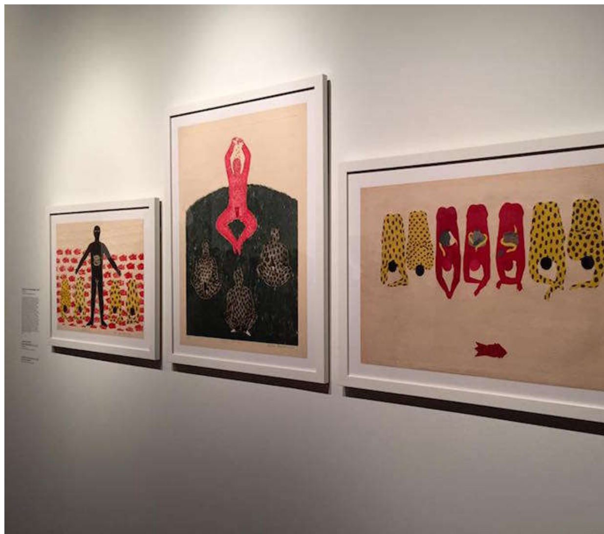
Tres obras presentadas en Nkame: A Retrospective of Cuban Printmaker Belkis Ayón.

Ponderar ese acercamiento múltiple y desprejuiciado a su obra, como arte, fue la intención sencilla dado que estamos hablando de un museo respetabilísimo en su condición del arte desde una perspectiva inclinada hacia la antropología cultural; pero creo que Belkis desde la estética, la ética y la teoría e historia del arte ayudó a complementar esta exposición.