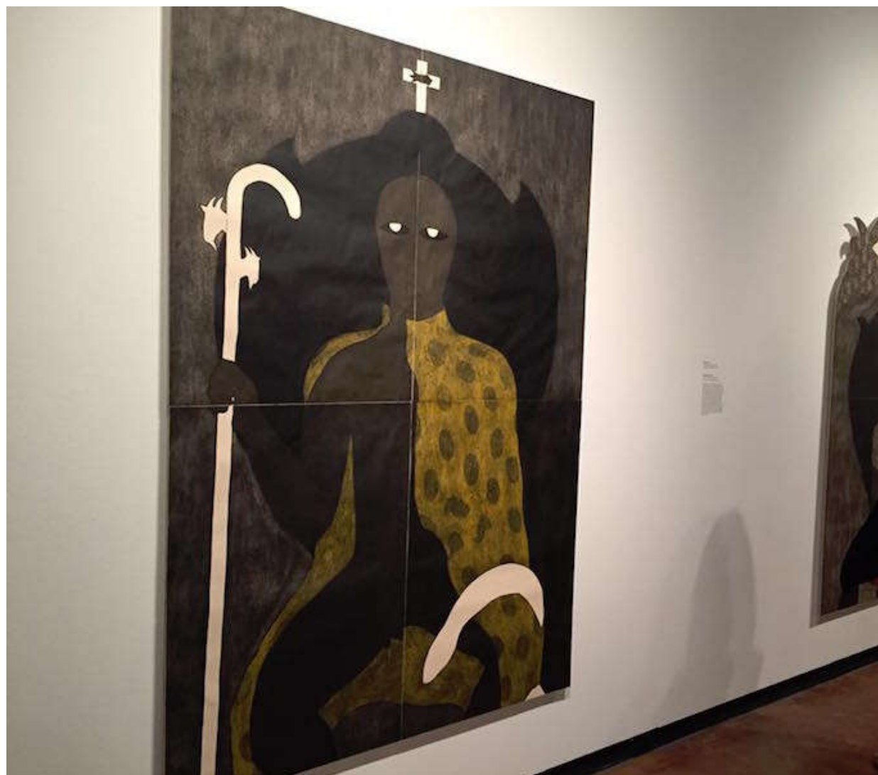
En la apertura de Nkame: A Retrospective of Cuban Printmaker Belkis Ayón.

en su obra como valor primordial. Insisto en que Belkis debe ser analizada como la artista que fue y que incluso ella reconoció expresamente en varias entrevistas y statements cerca de ella por casi diez años y haber compartido no solo momentos de creación sino de arresto en su carrera y en su vida.